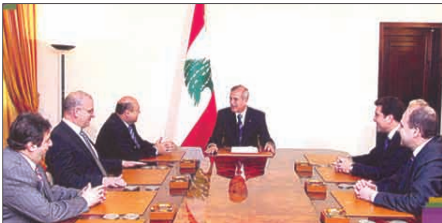
» VACUWYS • AXYI 3° X