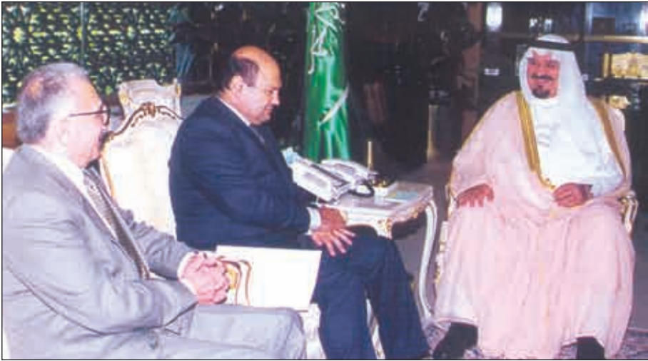
f&SS%l' C α XEWF μ 3 B "A" XrxM <w α Ce YI, Y5W