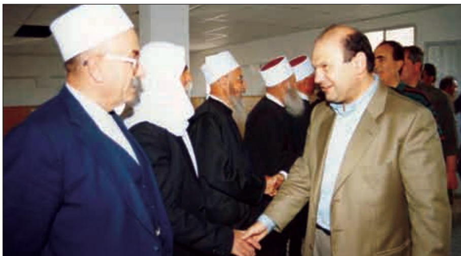
{ H E X I a w X ^ V G E F I