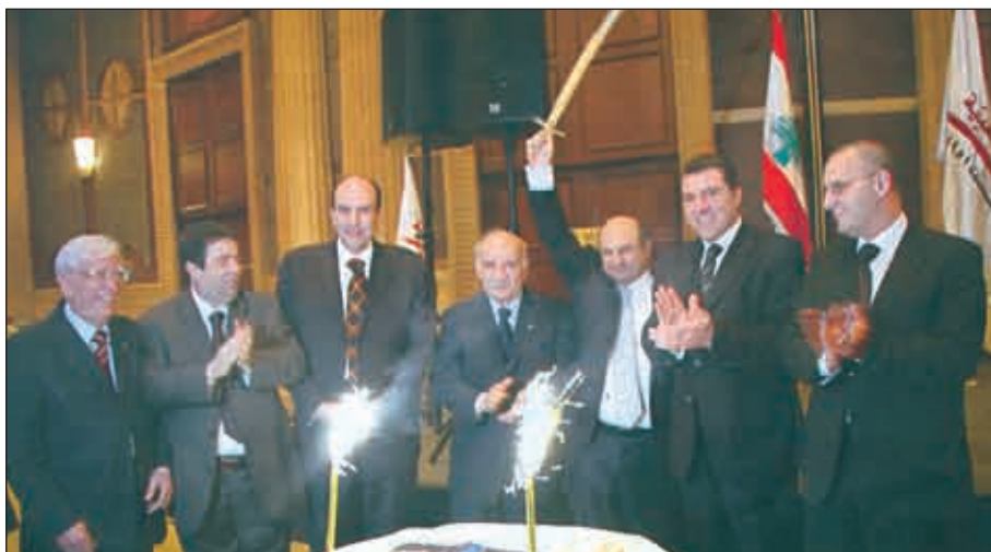
rÀ XEWÍ Xs ACW M