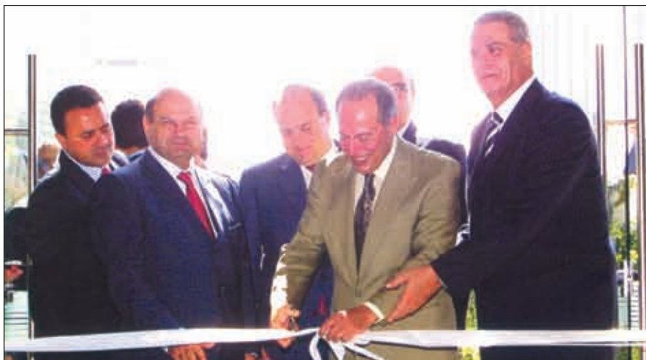
ISS (ICD) ~ ÁS • Á XY Y M Y % H U I