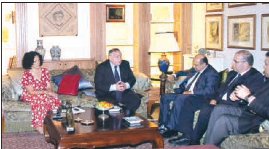
р&S, E-WC&XÔ; EFI »; "EWCW@