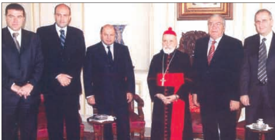
еТІ2““> ХХVІ ІА“ХІ|Х