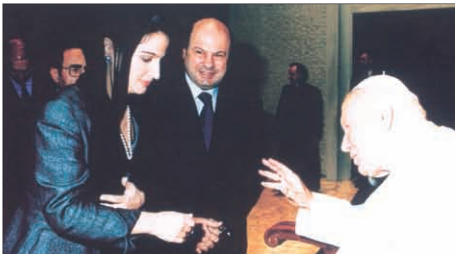
р&S%L» vÁXÔ 9EFI