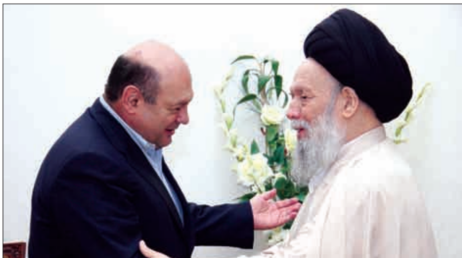
EX TÀ Uè TArjx rÀ XEWÍ