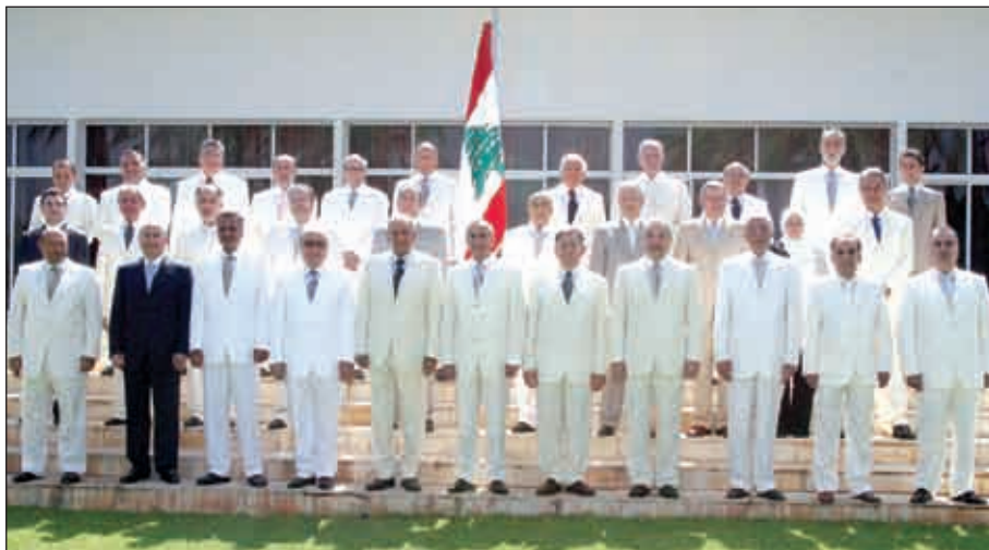
रूस-भारत संबंधों में नए आयामों का निर्माण