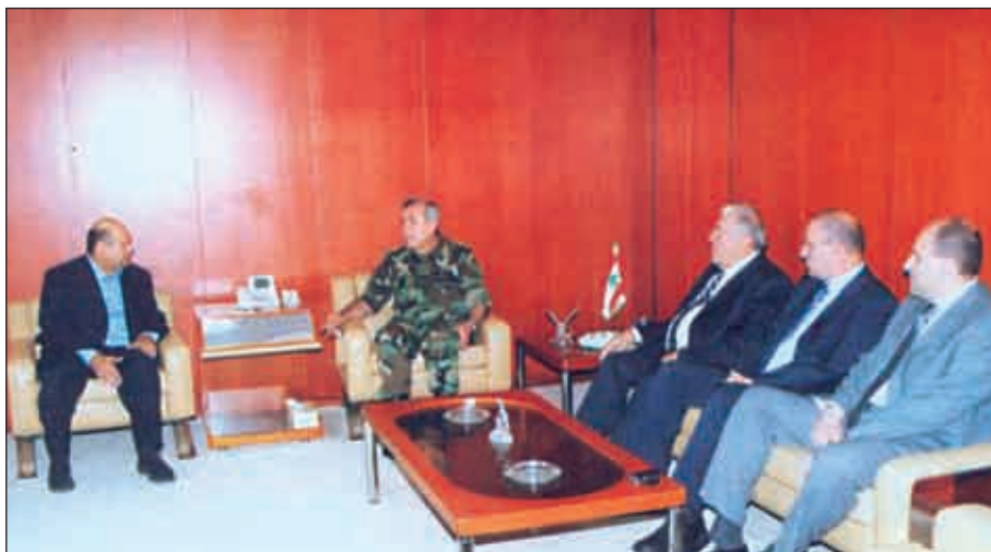
ISS+L> VAC TMAS-Ã ;r:WY{º°X