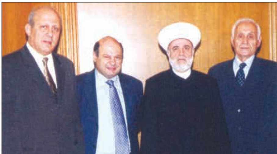
β w Á H E I x Á q X E F I