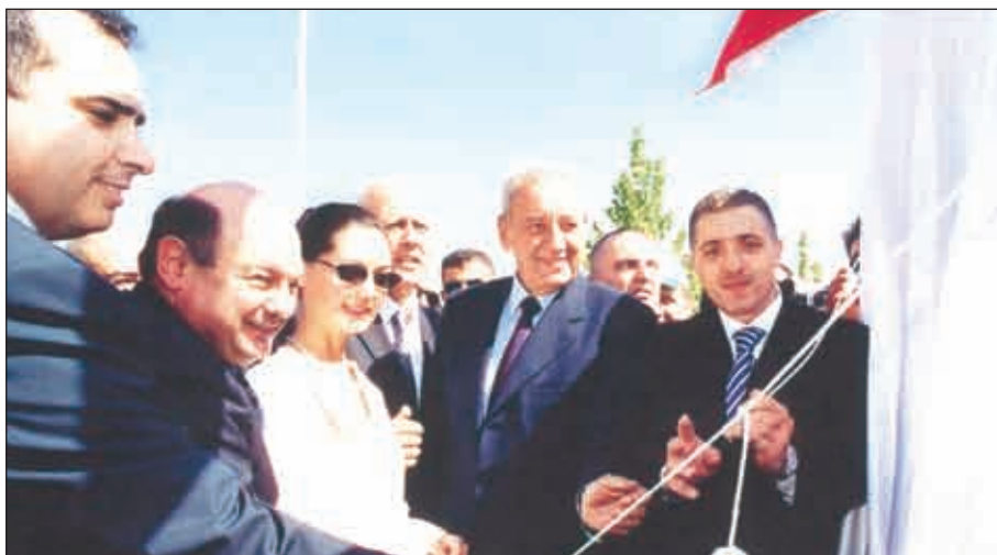
ISS* IÄ < 1/2 S • Á XY { 3 A F I " ° X I > † C G W I / „ A Y T N