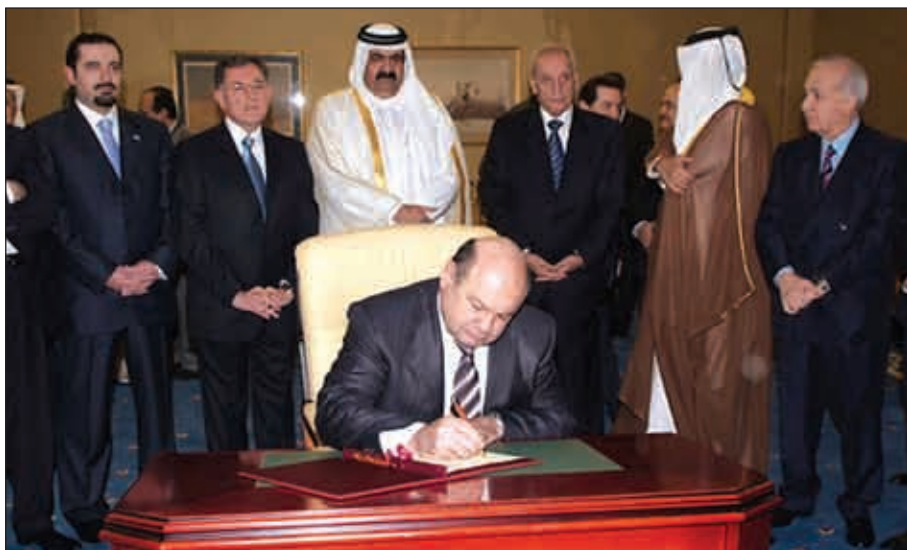
f&SS, HArX v; AMVY-wCSGAY: wX