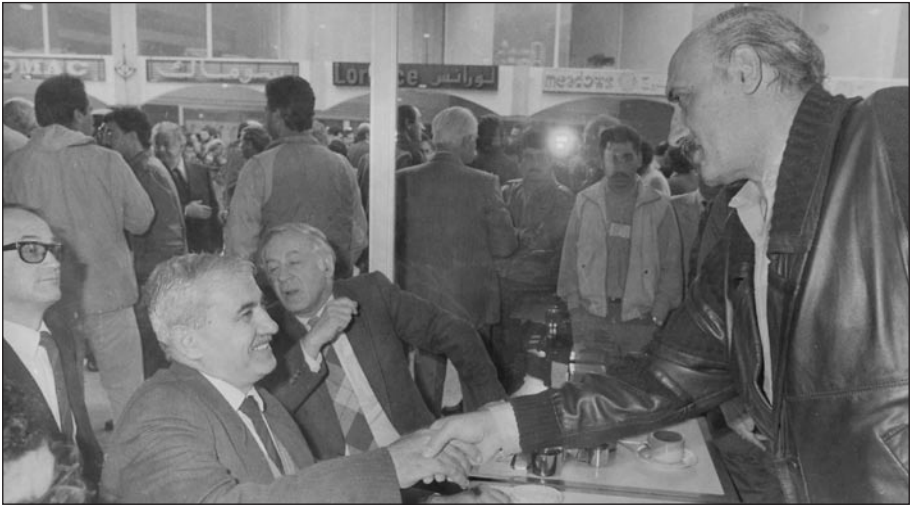
مصافحاً جورج حبش ويبدو خلفه السفير السوفياتي فاسيلي كولوتوشا في بعقلين