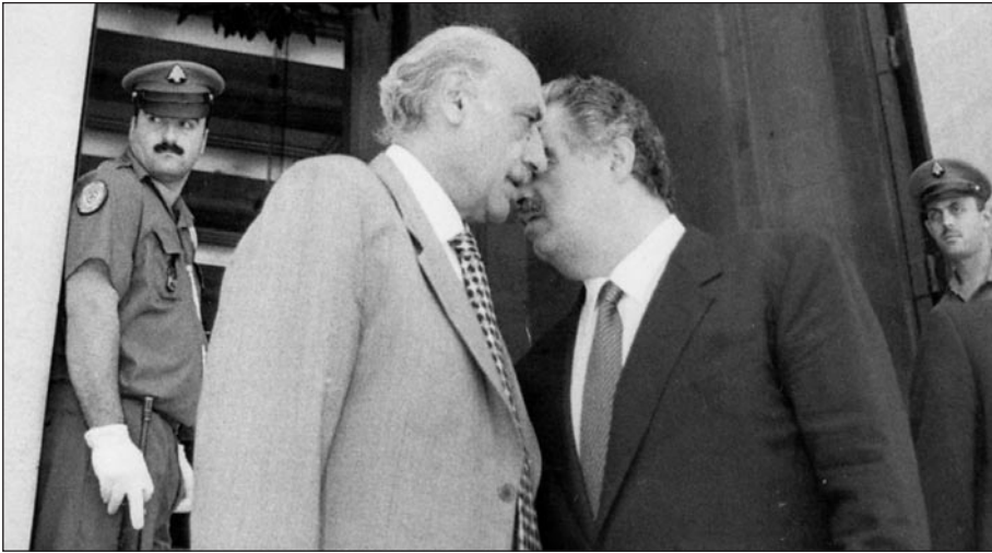
متهامساً مع الرئيس الشهيد رفيق الحريري أمام مجلس النواب