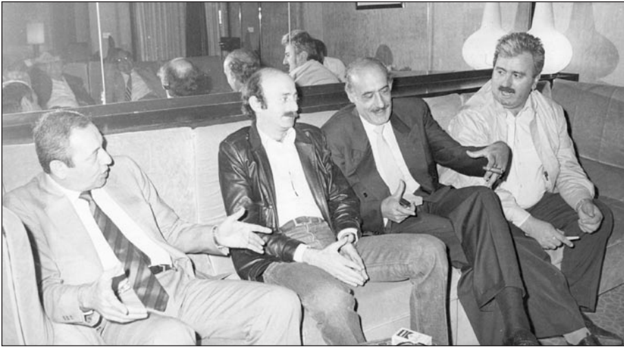
مع جورج حاوي ووليد جنبلاط ونييه بري في دمشق