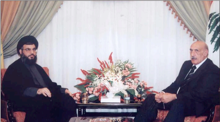
مع السيد حسن نصر الله