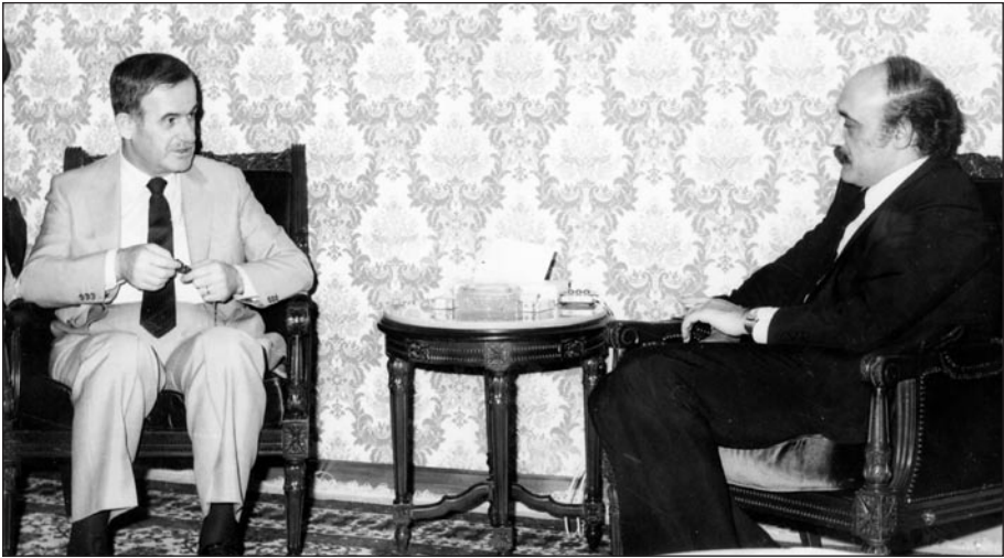
مع الرئيس السوري الراحل حافظ الأسد