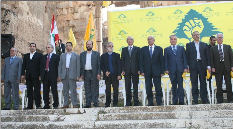
في صورة تذكارية مع أعضاء لائحة بعلبك - الهرمل أمام معبد باخوس في قلعة بعلبك