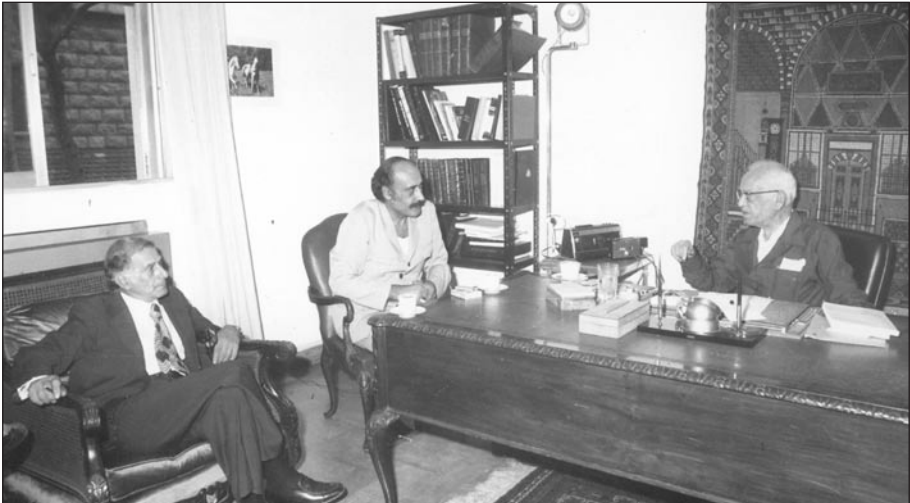
مع الرئيس الراحل سليمان فرنجية بحضور قبلان عيسى الخوري