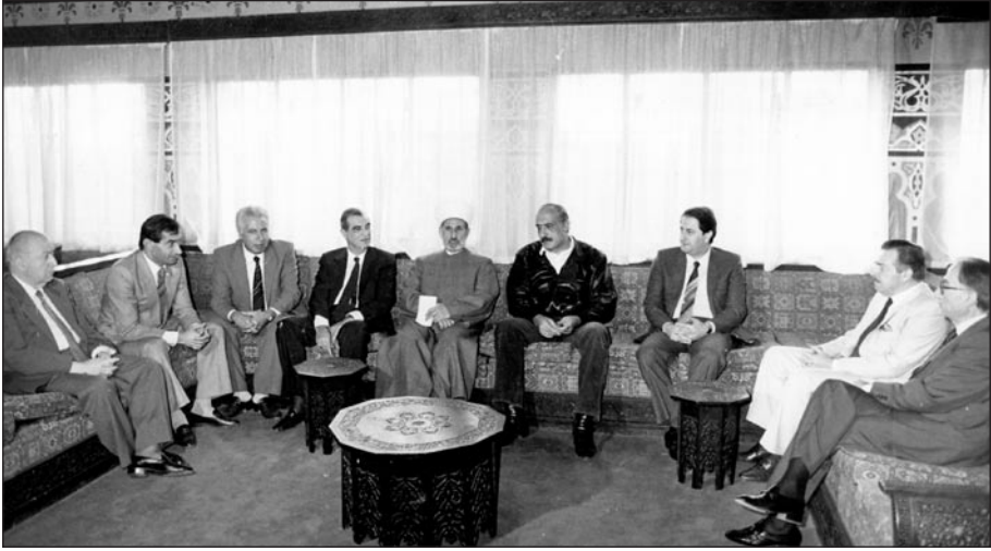
مع المفتي الراحل حسن خالد وبعض أعضاء اللقاء الإسلامي